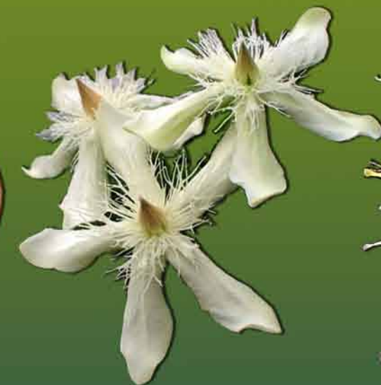
โมกราชินี