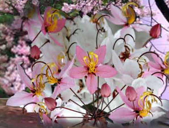
กัลปพฤกษ์