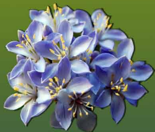
แก้วเจ้าจอม